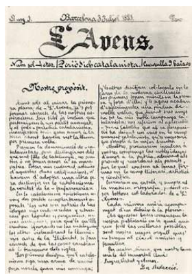
L'Avenc, una revista de cultura, fundada en 1881

s XIX apogeo de la revista semanal, considerada contemporánea por su profusión de ilustraciones